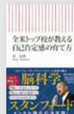
『全米トップ校が教える自己肯定感の育て方』 (朝日新書)